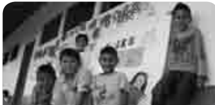
Por medio de murales en las 39 veredas del Oriente Antioqueño, los niños de las escuelas participantes en los Proyectos Ambientales Escolares contaban sus noticias y sus logros.