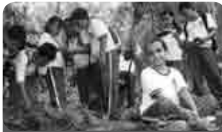
En el colegio La Candelaria del municipio de Cimitarra (Santander) existe la ecoaula La Isla; un sitio para estudiar sin paredes, sin pupitres y sin tableros. Este ha sido otro de los Proyectos Ambientales Escolares apoyados por ISAGEN.

ISAGEN en sintonía con esa manera de entender el medio ambiente y gracias a la extraordinaria posibilidad que abren los PRAE en su línea de educación ambiental a comunidades, ha venido apoyando el desarrollo, el seguimiento y la orientación de los mismos en las instituciones educativas de las áreas de influencia de sus Centros Productivos y Proyectos de Generación.