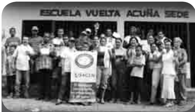
Los habitantes de la vereda Vuelta Acuña han sido muy golpeados por el invierno, perdieron sus cultivos y un huracán derribó varias casas, pero el espíritu de trabajo y perseverancia de sus habitantes se comprueba en las labores que desarrollan por medio del Programa de Desarrollo Comunitario (PDC).

En los medios ENCOMUNIDAD seguiremos contándoles cómo avanzan las comunidades en esa conquista de mejores condiciones de vida sobre la base de la dignidad, la participación y la autogestión.